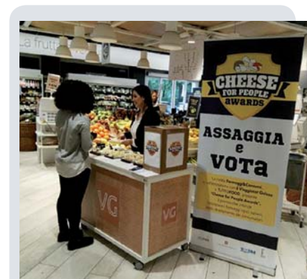
Un'immagine dell'evento Cheese For People presso il punto vendita il Viaggiator Goloso di via Belisario a Milano